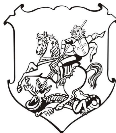
znak města platný od r. 1471