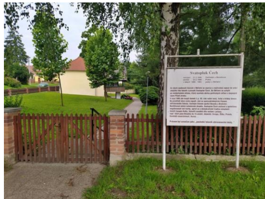
domek Sv. Čecha