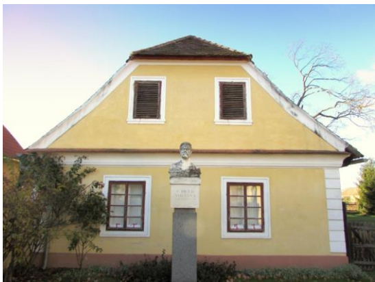
statek Lamberk, dnes Muzeum B. Smetany